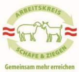
Veranstaltung AK Treffen Qualitätsbeurteilung von Schlachtlämmern